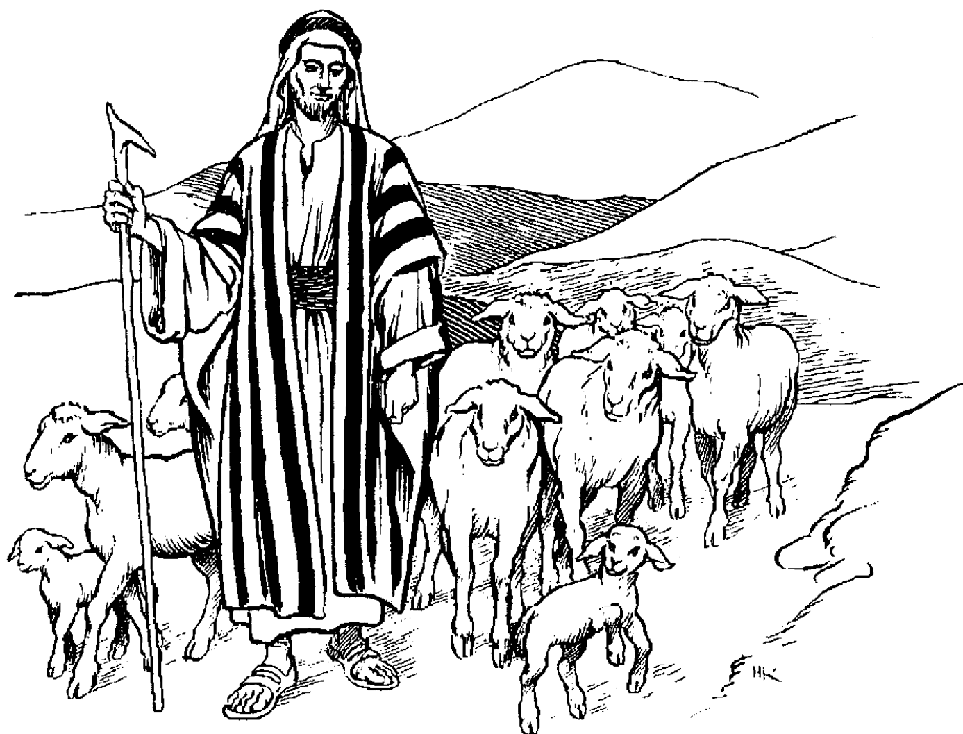
Sahzòq-k'èdɿ-dɔ̀ nezɿ (10.11)

11 "Sɿ sahzɔ̀q-k'èdɿ-dɔ̀ nezɿ aht'e. Sahzɔ̀q-k'èdɿ-dɔ̀ nezɿ sɿ edesahzɔ̀q gha elààwɿ hɔ̀t'e. 12 Sahzɔ̀q-k'èdɿ-dɔ̀ gha eghàlaedaa sɿ sahzɔ̀q-k'èdɿ-dɔ̀ elɿ nɿle, xàè wets'ò sahzɔ̀q agɿt'e-le t'à. Eyɿt'à dɿga